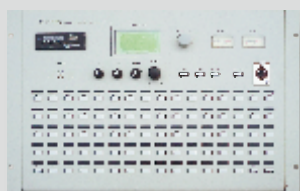
PD-7080 數位廣播主機/副機